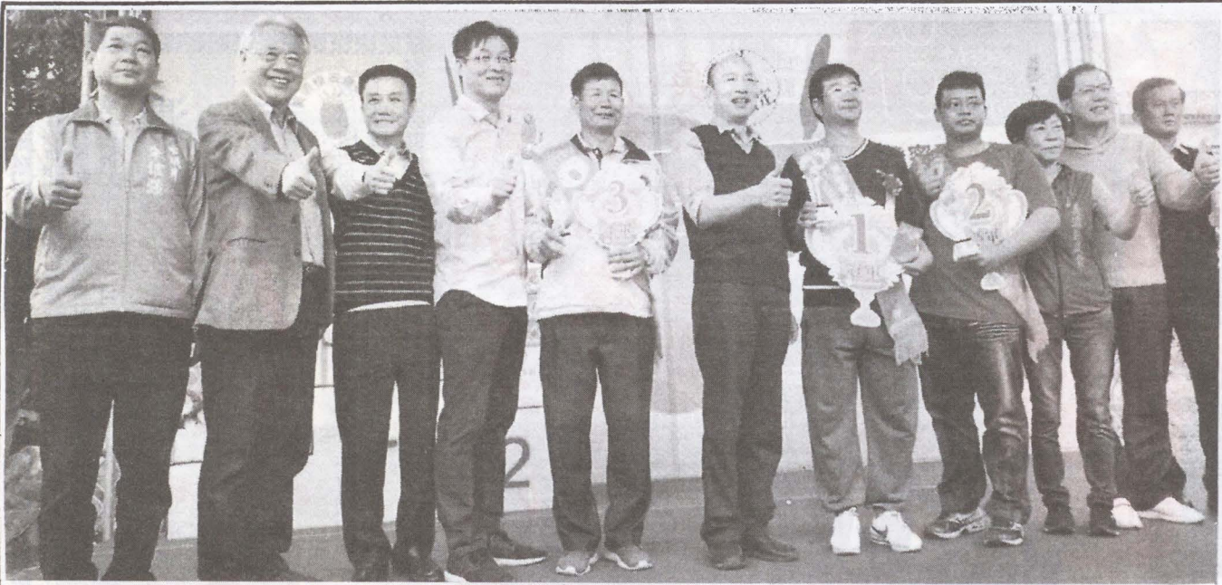
▲圖第七屆美濃小果番茄「橙蜜香」品質評鑑競賽-前三名得獎農民與長官合影！

專心耕作生產，注意品質穩定度，市府承諾一定會作堅實的後盾，並與農會全力合作，協助農產行銷，讓大家過好日子。 會中逐一頒發「橙蜜香」一箱加入選證書，並強調：頒發代表市政府重視農民朋友的辛勞與