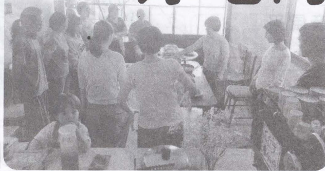
▲主廚介紹菜色。

除了食物，共食精彩的其實是這種混融的交流，包含農民與藝術家、返鄉子女與新住民間擦撞的火花。那麼當地老居民呢？就在我們左鄰右舍。