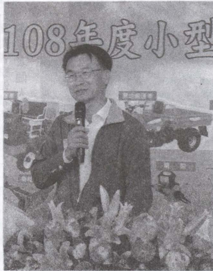
▲圖農委會主委陳吉仲主持小型農機補助記者會！