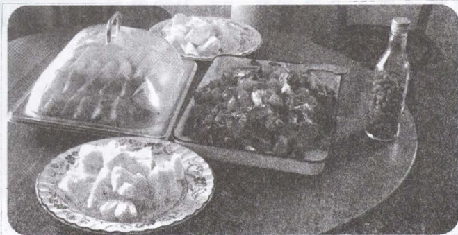
▲生菜沙拉甜點區。