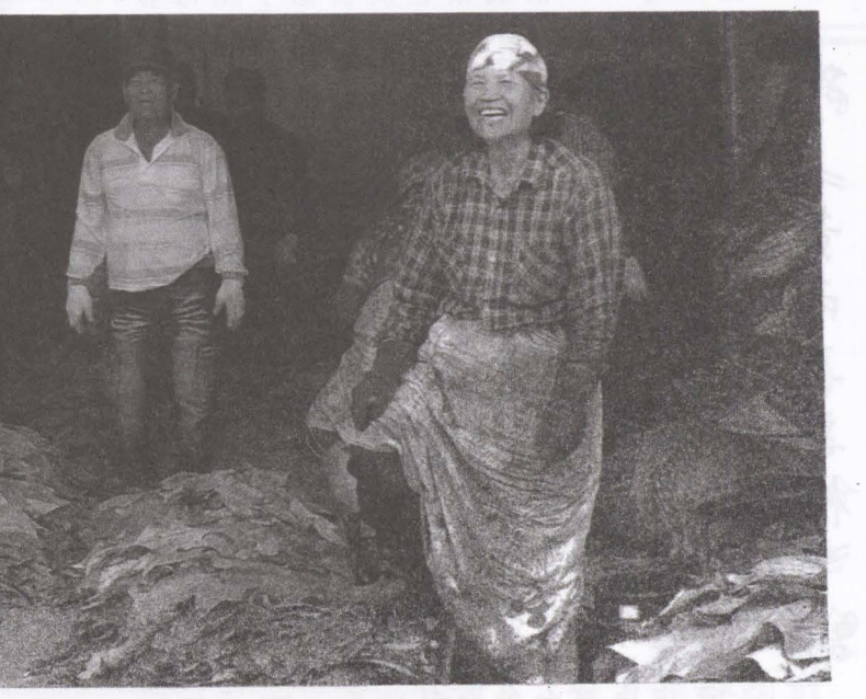
▲圖美濃菸業曾經輝煌，農村經濟的繁榮與政策息息相關。