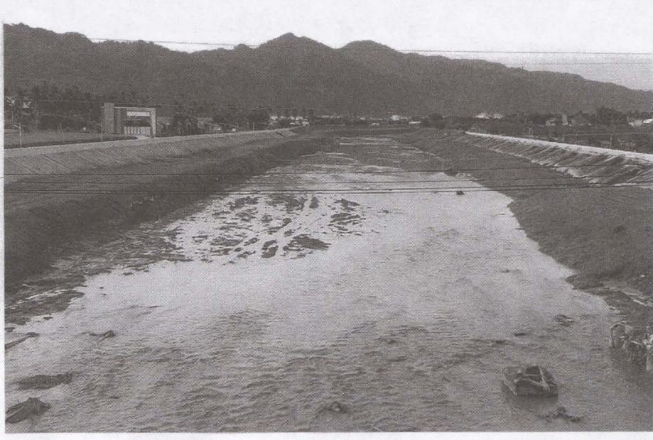
▲圖中壇橋下的美濃溪在梅雨來之前，已完成疏濬，感覺河道變寬了。