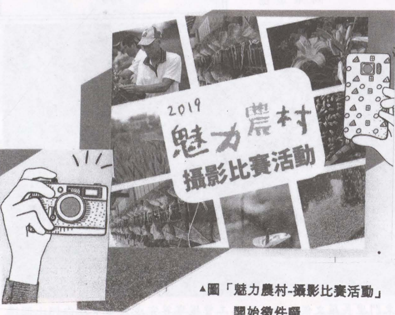
▲圖「魅力農村-攝影比賽活動」開始徵件囉

【農會訊】為改善農業缺工問題，組成人力活化團，媒合農場主需求與勞動力供給，建立農業人力活化及調度機制，以改善農業缺工問題。 1. 報名時間：即日起每日上午8時至下午4時止(假日不受理)。 2. 報名地點：美濃區農會推廣部(高雄市美濃區中正路三段100號)。 3. 電話：六八三三三〇九、六八三一六二四。 4. 報名文件：報名表(農會推廣部現場填寫)、國民身分證、農會帳戶(農會推廣部現場填寫)、國民身分證、農會帳戶影本、檢附報名者任何與農業有關之資料。