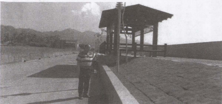
福安里中壇橋下美濃溪整治，經古里長陳情立法委員邱議瑩爭取預算整治，目前已整治完成並加高護岸，設置人行道、涼亭及種植草坪供里民休憩散步。

【水利會訊】梅雨季節到來，旱象解除，但汛期期間若降雨量過大且集中，容易引起洪澇災害。高雄農田水利會不敢大意，為確保轄區灌排渠道以及執行中的更新改善工程，於今年汛期期間確實做好防範及疏濬準備。