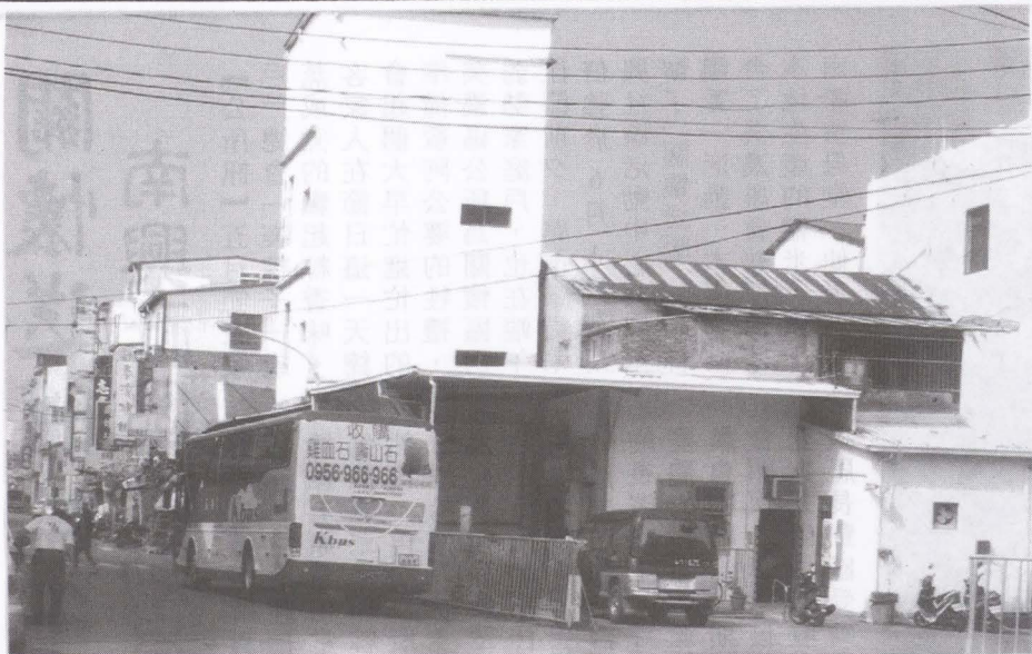
▲上圖像養雞場又似工地的美濃客運站，一直是旅外遊子批評最多的地方，何時大破大立，走著瞧！下圖也是被批評得一無是處的臨時攤販集中場，更是一項艱難的任務。

不說別的就以同屬原高雄縣四大鎮的三山加美濃，無論鳳山、岡山、旗山，他們都有運動公園，像樣的車站及市場，但我們該有的都沒有，好像美濃是小小三所生，未報戶口的兒子一樣不被重視。每次回到美濃看到那破舊的車站，心中就百感交集，說得難聽一些它有些像養雞場，再看看我們的菜市場，還是50年前的模樣從未改變，這哪像是已開發國家的樣子