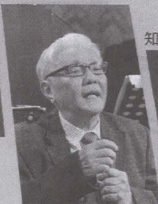
主講來賓 音樂大師 林煌坤