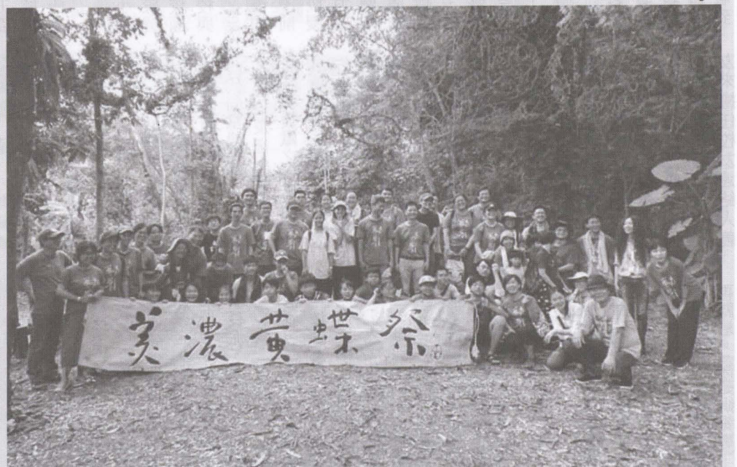
▲志工完工大合照。