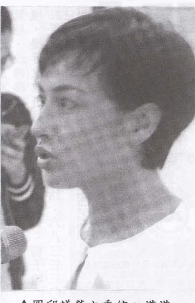
▲圖邱議瑩立委信心滿滿，目前積極拜訪基層尋求連任。