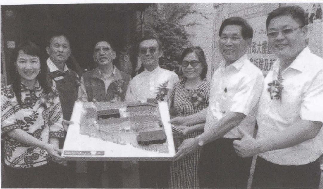
【本刊訊】百年老校美濃國小 6月24日舉行新校舍工程動土典禮 工程總經費達一億二千