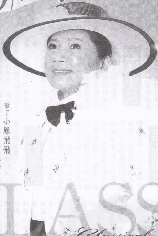
歌手小鳳飛飛 方寧