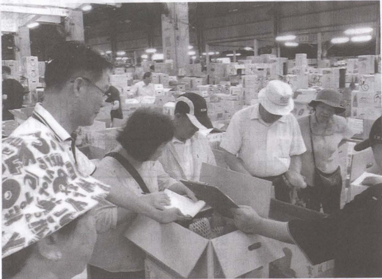
▲圖果菜運銷班員參訪-「新北市果菜運銷公司」實際了解美濃木瓜拍賣流程

【農會訊】農委會辦理外籍移工外展農務服務(引農業外勞)，改善農業季節性(如橙蜜香)或長期性(如野蓮)缺工問題，立意甚佳，尤其野蓮業者多所期待，然隨著「基本工資」可能再調漲，農場主原預計引進農業外勞，便宜又大碗的想法可能落空。 因基本工資、休假等條件，本勞外、勞無法脫鉤，導致目前引進農業外勞，每月工作22天，農場主每月須支付約3萬元(包含：基本工資 23100+勞健保 2664+就業安定費 2000+服務費 2000)，若基本工資再調漲，農業收入無法再提高，農民勢必再過苦日子。 避免物價指數上漲，