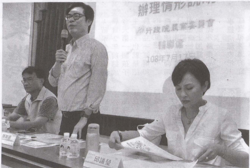
▲上圖陳吉仲主委、陳其邁副院長、邱議瑩立委為農民爭取福利。下圖農民鄉親關心自己權益到場聆聽相關說明。

【美濃訊】7月17日下午在美濃農會三樓會議室，針對農保及農民職災保險相關問題舉辦座談會，立委邱議瑩特別邀請行政院副院長陳其邁、農委會主委陳吉仲率相關單位聽取農民意見。