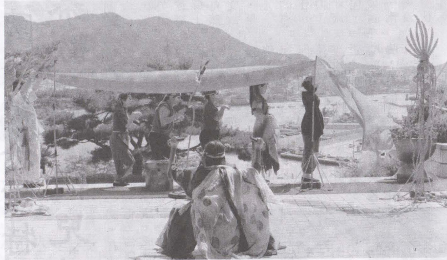
▲ 7/12的演出以統營的海港與淺山為背景，呈現不同於台灣的風情。。

《巡·里山》一劇可以追溯到二〇一五年，當時，差事劇團與美濃愛鄉協進會共同合作的《回到里山》一劇，是專業劇場與地方社區組織的成果結晶，由導演鍾喬與專業表演藝術工作者、美濃地方的文化工作者、農民等七名演員，共同創作完成，從二〇一五年七月底至八月底，歷經日本越後妻有大地藝術祭、美濃黃蝶祭與高雄衛武營藝術文化中心，三處共七場的演出，是一個從社區劇場轉變為劇場身體行動的過程。 在連結日本經驗與回到地方實踐的企圖之下，《回到里山》以墨西哥的水鄉傳說為骨架，一方面援引日本穴山村的鄉野傳說，另一方面也加入美濃的環境、土地議題，由主要敘事者（土地伯公），引領劇情開展，鋪陳一段關於人與環境（里山）的故事。 接著在二〇一六年，加入對空污、城鄉發展失衡的批判，以《尋·里山》為名，在夏秋之際，於美濃聖化宮的驕陽下，踩街隊伍一路從廟埕廣場，以民間鼓花陣的菱形步，腳踏家鄉的土地，而後完成出發巡迴前的首演，受到鄉親的熱烈迴響。之後，踏上在台中國家歌劇院與南投埔里紙教堂的巡演，與中部的觀眾交流。 今年《巡·里山》在七月十二、十三日兩天於統營市民文化中心的庭戶外空間演出，風和日麗的第一天，以統營海港為背景，演出過程中祭師的麥克風不慎鬆脫，綠絲帶因海風吹襲而掉落等等突發狀況，幸而團隊默契發揮，有驚無險的演出完畢。第二天則遇上落雨，團隊緊急將戶外場地改至有遮蔽的側邊通道，雖然演出腹地較為狹小，但人群的聚集相對集中，聲音效果也比戶外空間來得好，演員全心全意投入劇情，整體能量與情緒的傳遞更為強烈，感動了不少韓國觀眾，也為此行的演出畫下完美句點。 韓國統營劇場藝術節，位於距離釜山兩個小時車程的統營，是一個海港城市，藝術節今年已經進入第十一屆，是一個以表演藝術為主的藝術節，在七月十二至二十一日為期十天的活動期間，共有十六檔戲輪番上演，今年首度有來自台灣的團隊參與，對於韓國在地的觀眾來說，十分新鮮；而藝術節主辦單位對於台灣團隊也十分禮遇，讓人感受到韓國無微不至的待客文化。