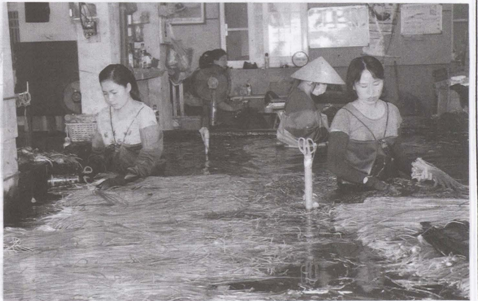
▲圖野蓮產業面臨長期性缺工問題！

【農會訊】高雄市婦女新知協會的法律團隊，提供在地居民免費的法律諮詢服務，7月至8月法律團隊將在美濃提供在地居民免費的法律諮詢服務喔！ 過去幾場的法律諮詢服務，律師不只傳遞專業法律知識，更幫助許多民眾走向正確的解決