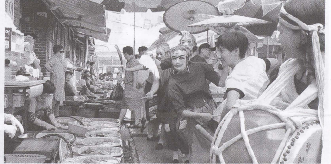
▲ 在正式開演前，到傳統市場踩街，演員手持美濃紙傘，臉帶手繪面具，與韓國民眾歡喜互動。(圖/差事劇團提供)。