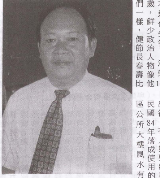
▲圖已故鍾紹恢鎮長。