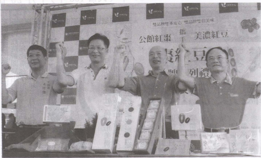
▲圖韓國瑜市長(右2)總幹事鍾清輝(左2)朱信強市議員(左1)公館農會總幹事韓鴻恩(右1)共同參與-公館紅棗&美濃紅豆，雙品牌「棗紅豆」禮盒發表會！

【農會訊】本會與苗栗縣公館鄉農會，締結姐妹農會多年後，今年首度連袂推出「棗紅豆」系列禮盒，標榜「雙品牌」雙重保證，雙品牌「雙倍美味」。 7月16日韓國瑜市長受邀出席見證發表會，除了稱讚苗栗公館紅棗品質優良，也指出美濃是高雄的風水寶地，有非常棒的蔬菜水果稻米，還有紅豆，高雄紅豆佔全台20%，期盼消費者對公館及美濃的農產品有信心，請大家多多消費、享用，並祝福雙方攜手合作禮盒發表會圓滿成功！ 高雄市農業局長吳芳