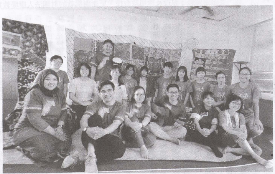
▲美濃與印尼夥伴共同完成的里印染拼大型布製品。