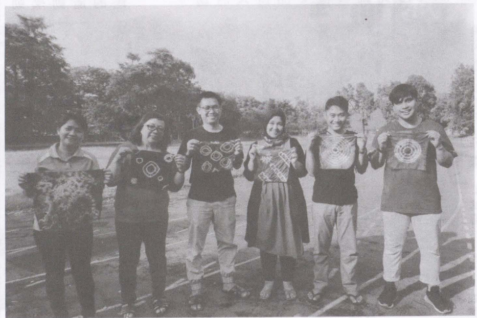
▲印尼夥伴首次體驗客家藍染。