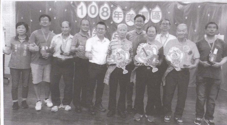
▲圖「美濃稻米品質評鑑競賽」全體得獎稻農與長官貴賓合影