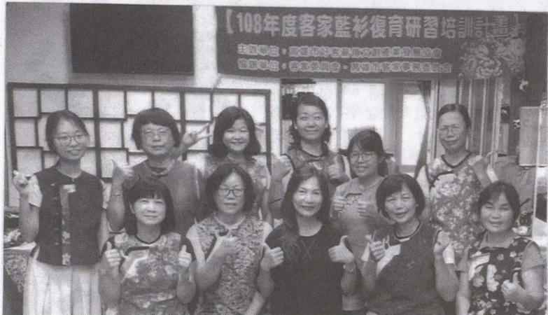
主辦：高雄市好客薪傳文創產業發展協會