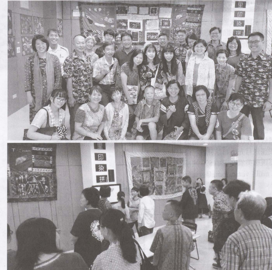
▲「里印染拼」作品展即日起至9/22於高雄市圖書館美濃分館二樓展出

客委會表示，新住民是客家庄的重要資產，透過新住民第二代，把母國文化與台灣文化串連，這樣不僅讓文化交流更多元，對於政府推動的新南向政策，也能打下更穩固的基礎。