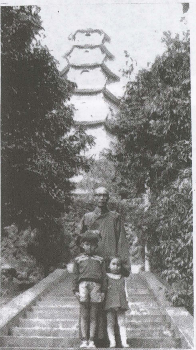
▲圖已故法鼓山創辦人聖嚴法師，年輕時曾在雙溪黃蝶翠谷前的朝元寺閉關兩年，珍貴老照片中的兩位小孩，不知是否為美濃鄉親？現在應該50幾歲了，有誰認出他們是誰嗎？

愛心物資的力量發揮到最大的效用。 近幾年因應社會急遽變遷，且伴隨著新住民、外配的加入，亦面臨超高齡社會與少子化現象，我們期望更多具有服務精神的在地人投入社區志工的行列，為美濃創造更大的福祉、服務更貼近弱勢者的需求，讓愛與關懷來協助並解決受助家庭短期的基本生活問題。