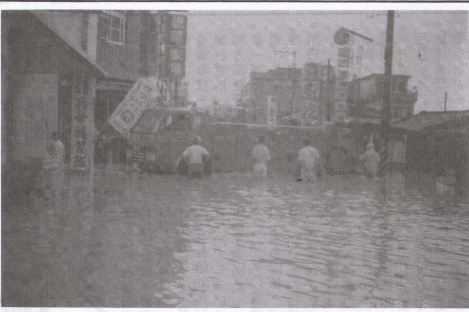
▲圖民國81年中正路第一戲院前淹水情形，消防車前來抽水，下圖災民乾脆苦中作樂玩起划水的歷史鏡頭。(本刊資料)

法論，也是局部察驗與民眾主動反映之治水策略。於今不再寄望政府之主流或大方向扎錢頭痛醫頭式治標，應宜由居民主動、行動觀察自家門前淹水狀況，共同做：疏濬、更換水函管、拓寬河道、加設排水道引流、清除河底汙泥等治水決策，然後大家一起來聯署，最後才是請公共工程單位協助完成。如此才是真正疏通、問題解決、治本及調適哲學之治水之道！