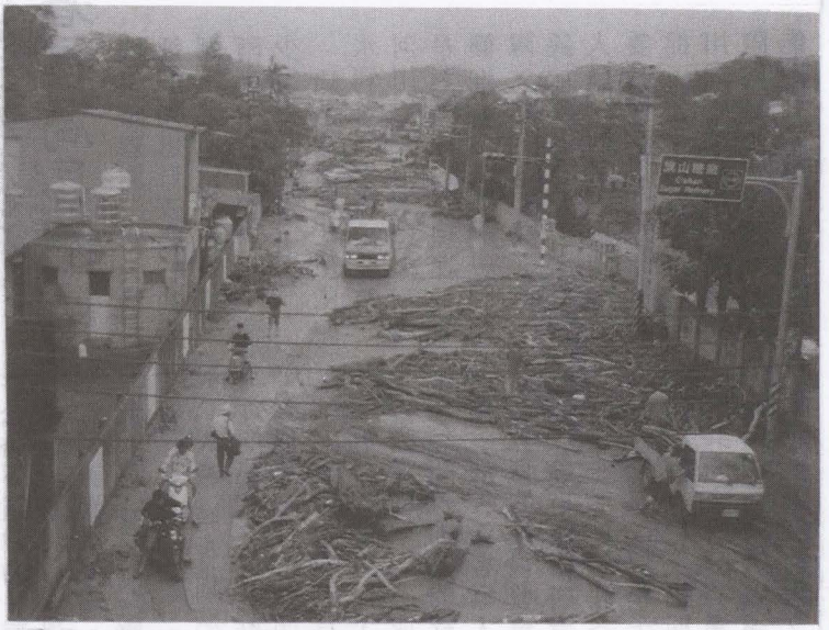
▲圖11年前八八風災造成重大災害，旗尾溪的漂流木竟然漂到旗美高中與糖廠，場面令人震驚。