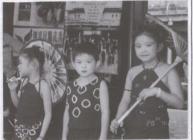
▲小朋友是客家母語存亡的關鍵，市府相當重視。

慶—客家婚禮·客家宴」將於11月2日舉行，明年(109)年2月也將擴大規模辦理「美濃二月戲」，希望客家鄉親大力支持市府各項政策，使客家事務能順利推展，讓高雄客家更為璀璨美麗。