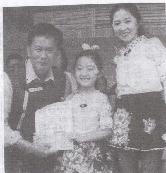
▲小朋友是客家母語存亡的關鍵，市府相當重視。

【高市府客委會訊】高雄新客家文化園區舉辦「盛夏藍·藍染趣」日頭下的DIY藍染體驗活動，吸引上百位親子參加，在兩豆樹綠蔭下親手染布，透過揉捏、網綁、浸染，感受「青出於藍更勝於藍」的傳統染布魅力與樂趣。 高市府客委會主任委員黃永卿表示，新客家文化園區具有客家建築特色和林蔭綠地，景緻宜人，未來會陸續辦理親子寫生等大型活動，邀請民眾在秋高氣爽的時節一起來同樂，感受客家文化園區的熱情活力。