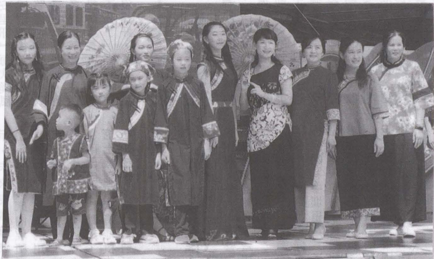
旅外鄉親讀者 近期繳費名單 三民區劉廷昌一千三百元 鳳山區宋雲煥一千五百元 台中市曾達華六千元 屏東市葉秋美二千元 三民區張存輝一千三百元