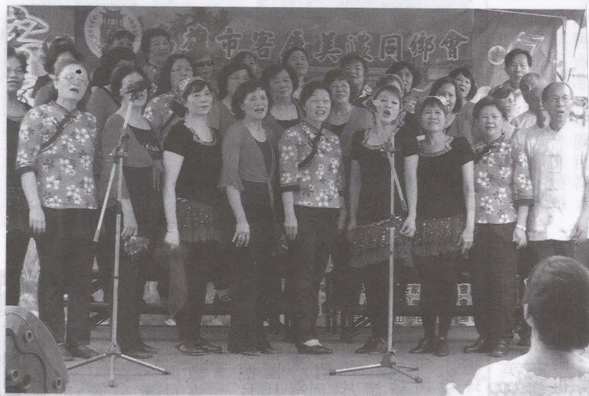
▲眾多合唱團練唱或表演客家民謠傳承歌謠文化值得獎勵。

劃「六龜區資源調查研究」等四案計畫，合計新臺幣3,571萬元建設經費，對改善客庄區生活環境品質，極具效益。 市府團隊為保存客家傳統文化不遺餘力，「二〇一九客庄12大節