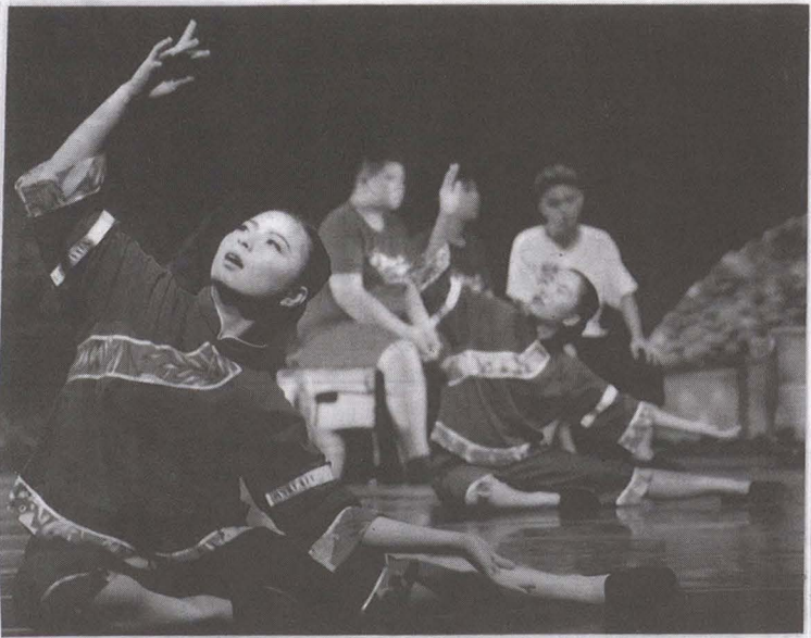
▲創新藍衫賦予新生命，讓客家美學發揚光大。

1. 客庄區：推動「幼兒客語沉浸教學」及「國小客語雙語教學」，以客語作為授課的主要語言，並辦理師資培訓計畫，提升教師專業知能。108年計有美濃區、六龜區五所幼兒園及八所國小參與。 2. 都會區：推動「簡單生活客語教學」，全力提供教學所需客語師資、教材及鐘點費，108年共有97所學校開辦客語教學課程或活動，合計7,818人次。 二、成立全臺第一所「客家實驗學校」：成功輔導美濃區吉東國小成為全臺第一所客家實驗學校並於108年正式實施。該校除了發展客家文化主題課程，並在低年級實施客語陪伴班，建構接軌國際教學教法之全客語學習環境，讓小朋友從小習慣講客家話且認同自己的文化。 三、舉辦客語親子說唱活動：為落實「母語在家學」政策，4、9月於都會區及美濃區共辦理四場親子客語說唱活動，增加親子間學習客語的傳承動力，提升「家庭說母語」風氣。