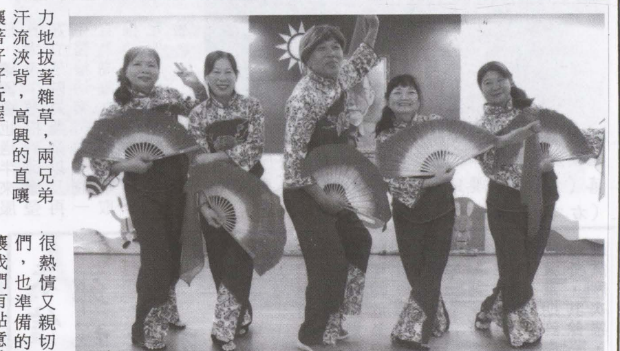
▲圖家政班年度成果發表會-廣興班舞蹈表演!