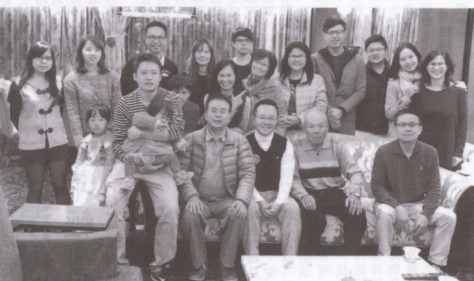
圖王新樹鄉親三代同堂幸福大合照。