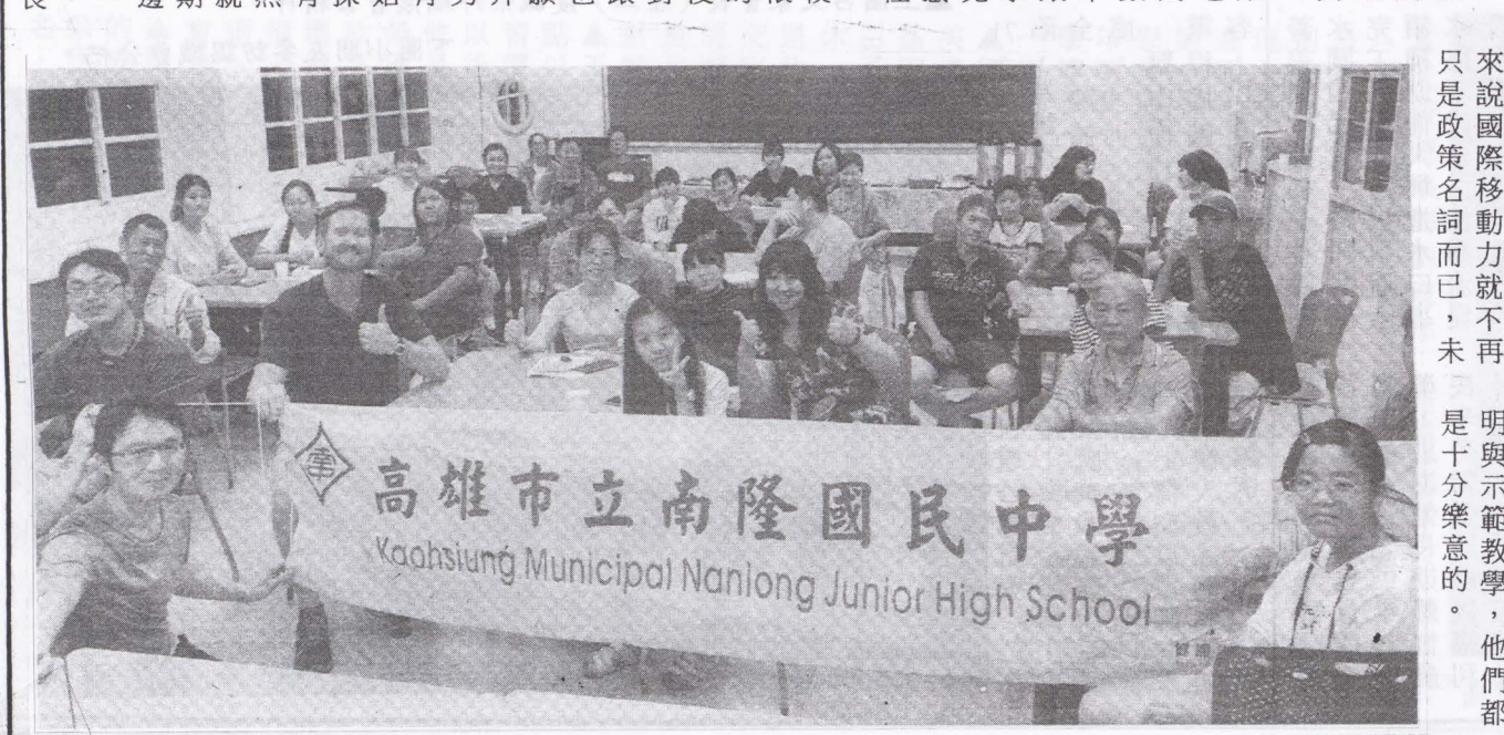
高雄市立南隆國民中學 Kaohsiung Municipal Nanlong Junior High School