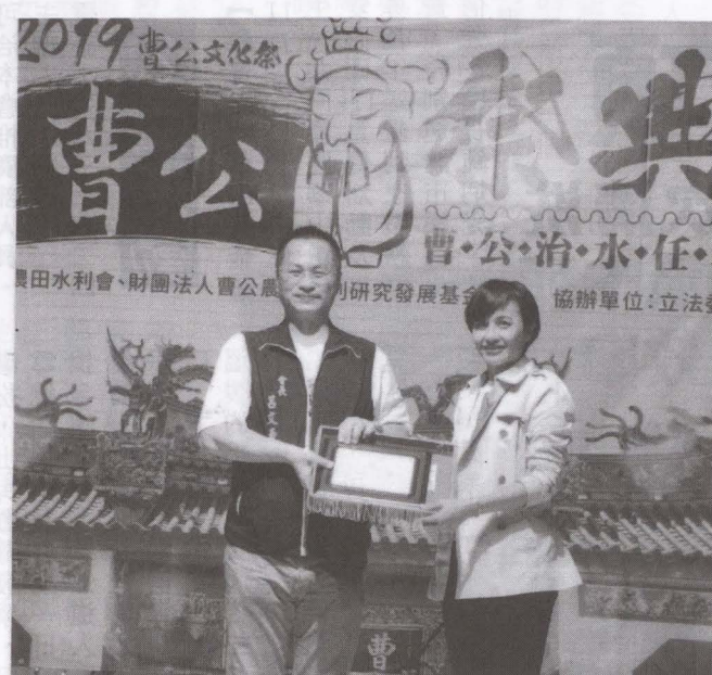
▲圖為邱議瑩立委獲獎重要事蹟：一、爭取農業天然災害救助：105及108年大樹區玉荷包荔枝災損補助每公頃9萬元現金補助，總計發放2.4億元、燕巢區石榴災損補助總計發放1.77億元。二、爭取農保「人地脫鈎」只要認定「務農事實」就能納保：政府鼓勵青年務農，但多數青年因無土地無法申請加入農保、農會，邱立委向農委會爭取農保要「人、地脫鈎」，現在只要符合資格有務農事實經認定後即可參加農保及申請農業天然災害現金救助。三、爭取退休軍公教勞務農加入農業職業保險。四、爭取未符合老農喪葬救助10.2萬元：讓辛苦一輩子的老農在臨終時保障領取喪葬救助。五、農業保險法：目前行政院已拍板「農業保險法」草案，未來送到立法院三讀通過後農民保費更少，保障更多。

積極為農民發聲請命爭取福利 邱議瑩榮獲「曹公獎」表揚 【水利會訊】高雄農田水利會與曹公農業水利研究發展基金會於11月1日在鳳山區曹公廟舉辦曹公23週年聖誕祭典及晚會，今年一系列曹公文化祭活動在祭典晚會達到最高潮，場面熱鬧，晚會重頭戲除了精彩表演就是曹公獎得獎人頒獎。今年曹公獎得獎人為立法委員邱議瑩，由水利會會長呂文豪頒發曹公獎感謝邱立委長期為農民服務貢獻及為農民發聲請命。(下圖) 呂文豪會長說，農民和水利會不可分割，邱立委對農民的服務貢獻值得頒贈曹公獎，邱立委在10月4日立法院對行政院院長總質詢時針