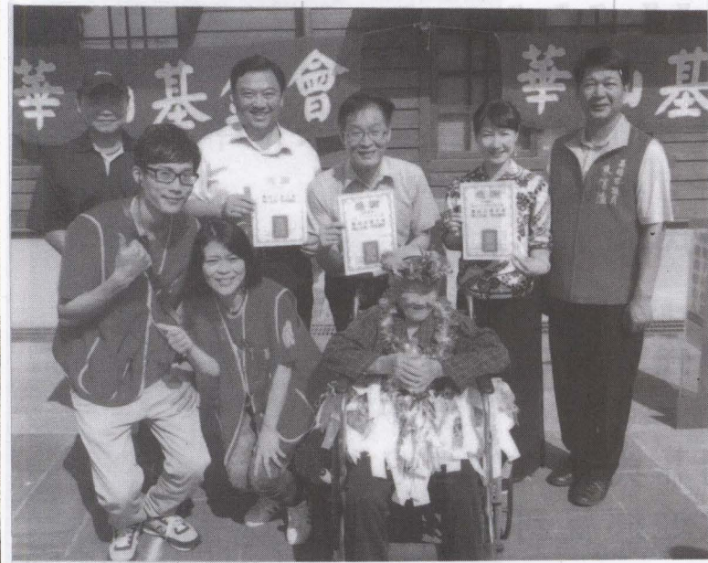
▲上圖里長、區長、總幹事、校長、市議員等一起為華山基金會上街募集發票，下圖小朋友在街上向路人募集發票情形。

華山基金會特別選11月1日在全台20個縣市，同時舉辦「111齊心助老募發票」公益活動，美濃國小學生在美濃街頭募發票，店家零錢一日捐，期盼透過老道化裝扮，讓社會大眾知道我伸出溫暖的手關懷老寶員，原高縣出動494位義工一起號召「一張發票一份愛心、幫助孤老過好年」。