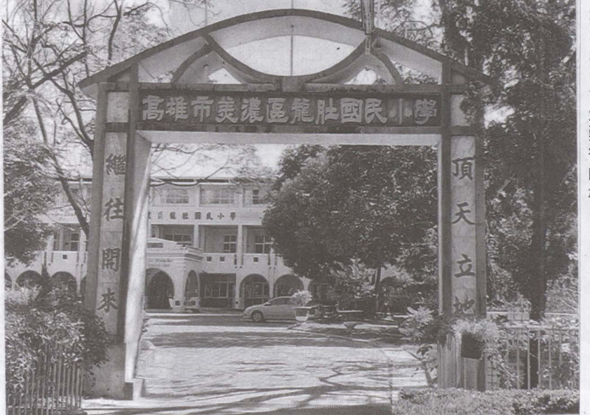
▲圖龍肚國小特別的校門，無數校友穿梭其間。