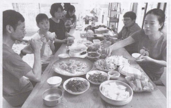
▲工作坊期間中最重要的一个環節：共食。

開始接觸及尋找自然素材如何運用在生活與地景配合之故，看到美濃二〇一九黃蝶祭編織工作坊的課程，便隨即報名參加，工作坊的目的標是師生夥伴們共同完成的大型編織品，作為