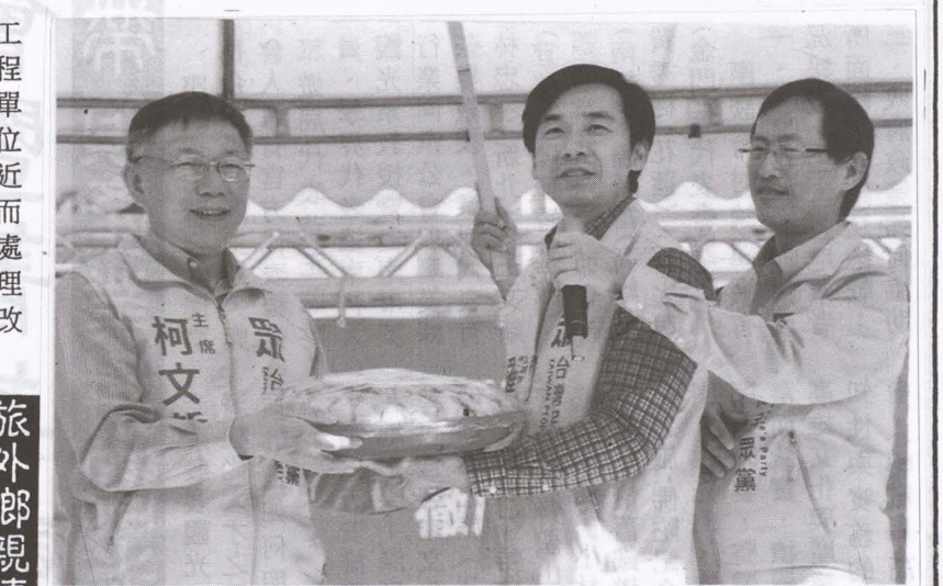
▲圖柯文哲市長與美濃兩位立委參選人羅鼎城(第一選區)與馮啟彥(不分區席次)合影。