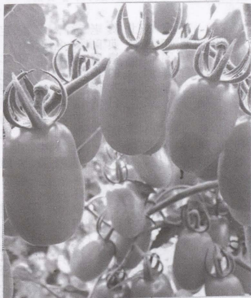
▲圖將蜜香番茄上市囉！

【農會訊】近日天氣轉濕冷，為番茄晚疫病好發環境，農會籲請農友及時防範番茄晚疫病危害；田間一旦發病，則應立即剪除受害枝葉，並隨即清園，再施用晚疫病防治藥劑，以遏止病害蔓延。