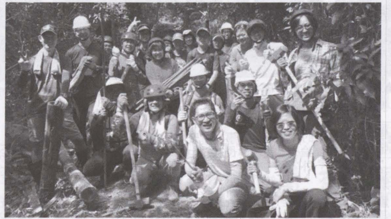
▲學校教職員共同參與拆棧板、搬石頭、砌步道的過程中。

臨暗，一小群人拿著頭燈，在暮光透不進的樹林裡，奮力將木釘敲入更深的泥土，直到把最後一根原木埋入步道，經反覆調整、固定位置後，才滿意地收工下山。 這是來自台中、台南、高雄各地的步道志工，以及屏東大學 JSR 搖滾社會力的學生，加上龍肚國小教師、畢業校友、友善小農、社區夥伴等等，利用十月三、四週未假期，以手作步道、慢工細活的方法，協助龍肚國小後山生態園區進行步道整理的活動。