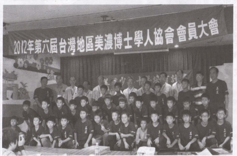
▲101 年啟動美濃少棒十年培育計畫選選小選手後的第 1 張合照

推展美濃少棒十年計畫是有著「自己家鄉自己救」的使命，堅持從品德教育、生活教育與客家文化等核心價值著手，讓身處美濃而有興趣打棒球的孩童，從小就被灌輸球技、課業、品德都不能忽略的觀念；球場上不只傳授棒球技術，更教導生活禮儀，讓孩子懂得尊重教練、球友、球場及球員。或許孩子們不可能打一輩子的棒球，但教授的觀念可以讓他們受用一輩子。希望我們的下一代能快樂打球、打球快樂，追求允允允武的學習。相信這些細微的改變是可以被期待的，並且可以被看見的，只要我們願意持續攜手為孩子們的未來努力。 第一年運作到將邁入第九年了，從 8 人少棒扎根到青少棒延續，過程中曾達百人在訓練，經費從第一年計畫開始支出為 101 年度 739,850、102 年度 846,740、