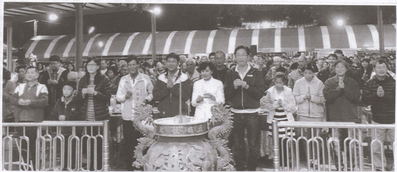
▲圖上千名農友聚集五穀宮祭拜農神大帝，期盼來年所有農產品都能大豐收！

【農會訊】農會辦理強制汽(機)車保險，方便、快速，隨到隨辦，還有任意險讓您(騎)開車更有保障。 車主若未投保汽(機)