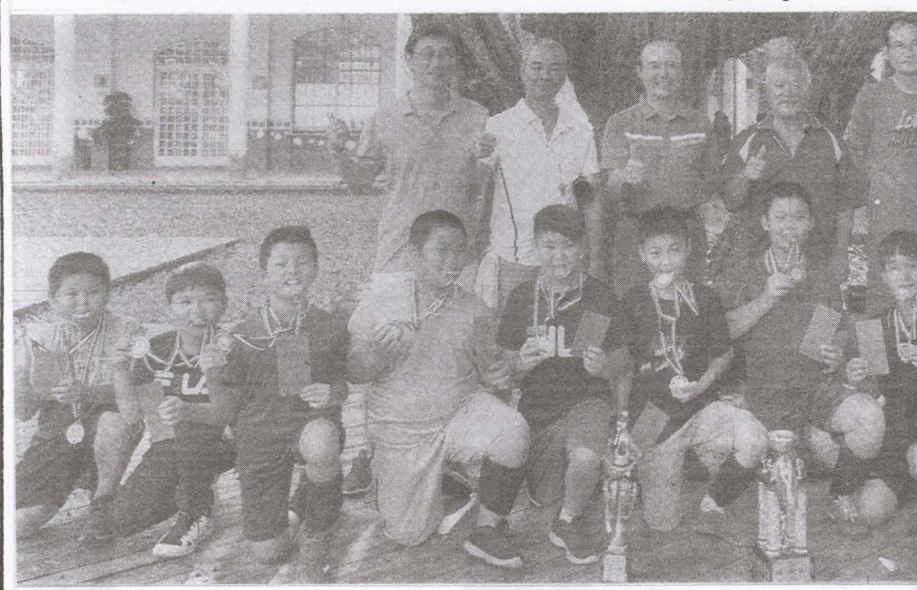
▲龍山國小排球隊近年參加比賽皆名列前茅，是當前家鄉唯一有排球隊的學校。