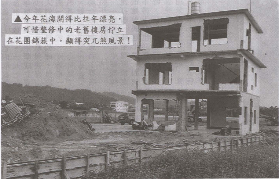
▲圖高雄一位畫家買主正在改建拉皮的花海區獨立屋。

【農業課訊】本(109)年度「一對地綠色環境給付計畫」，水稻繳交公糧、稻作直接給付、轉(契)作、生產環境維護措施(翻耕、綠肥作物)及新增之農業環境給付