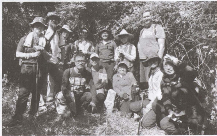
▲「行讀美濃山」學員於后山三角點。

重新描繪路上的風景。若以幾乎日日登山、總是笑稱自己「靠呼吸賺錢」的退休老師鍾益新班代的平日速度，這些山徑可能只消二十分鐘至一小時即可完成。但是，這些教學活動的山徑，短則兩公里，最遠也不及十公里，每一次卻要花上五、六個小時。經由時間的延展，讓空間被深化。