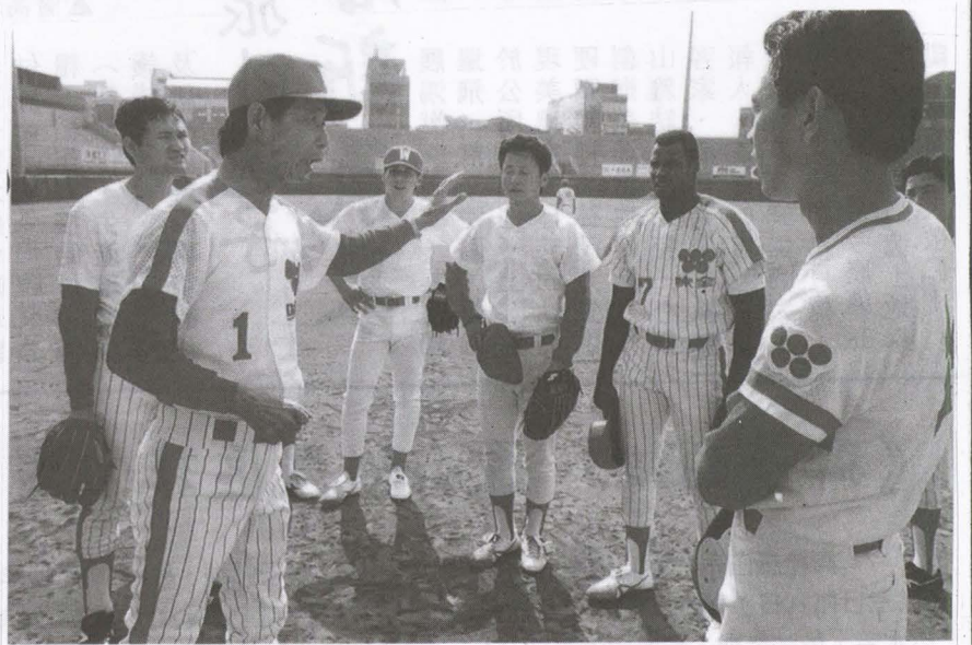
圖味全龍隊第一位總教練宋官勳(左1號球衣)

味全龍不僅封王，且以4：2摘下總冠軍，而成了國內首位囊括自少棒至職棒的一五冠「總教練」。 職棒二年，宋官勳因罹患白內障眼疾，不便督軍，因此將味全龍總教練寶座拱讓給同是美濃出身的愛將徐生明接掌。宋官勳因使不上力，而後請辭返回高雄。二〇〇八年一月四日病逝家中，享壽78歲。 中華職棒元年開打，兄弟象總教練曾紀恩、味全龍總教練宋官勳，二人均是昔日美和中學棒球隊教練團出身，進而場上較勁分出高下，也傳為棒壇佳話。曾紀恩教練素以治軍紀律嚴明著稱，宋官勳教練則以技術服人。由於宋官勳平日即喜歡讀書，加上看懂日文的棒球書籍，豐富了他有關的棒球素養，曾、宋二位總教練先後進入台灣棒球名人堂，也顯見他倆都