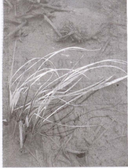
▲圖低溫危害時，稻秧葉片容易出現枯萎徵狀！

【農會訊】16日晚間開始冷氣團低溫來襲，提醒農友適時進行防寒措施，並隨時注意作物低溫後之生長變化，即時 因應以減少損失。 ★提供低溫防範措施： 一、水稻部分—美濃地區水稻目前都已插秧，初期受到寒流或冷氣團侵襲，可能使秧苗枯死，而必須要補植；建議田區可於傍晚時灌溉，水深3至5公分，藉田水讓田間溫度不要下降得太快，進行保溫，防止葉片受寒害，翌日氣溫上升再排水，恢復一般管理。 二、蔬菜、瓜果類—對較不耐寒蔬菜與瓜果類，應設置防風牆、防風罩、塑膠布或選用稻草或不織布直接覆蓋，