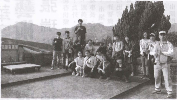
▲新年福恭送伯公儀式，美濃國中客家八音社文化服務志工與美濃客家八音團團員於水口里社真官宮合影。

高雄市文化局已於一〇七年九月十日明文公告「瀾濃永安庄伯公福入年駕祭典」登錄高雄市重要民俗。每年農曆十二月廿五日舉辦「滿年福」，美濃永安庄民迎請周圍的九座伯公福神至搭建的臨時福廠過年，「入年駕」為期二十天，至翌年農曆元月十五日舉辦行新年福儀式，隔日送神、卸壇、拆除福廠，才算是出年駕。