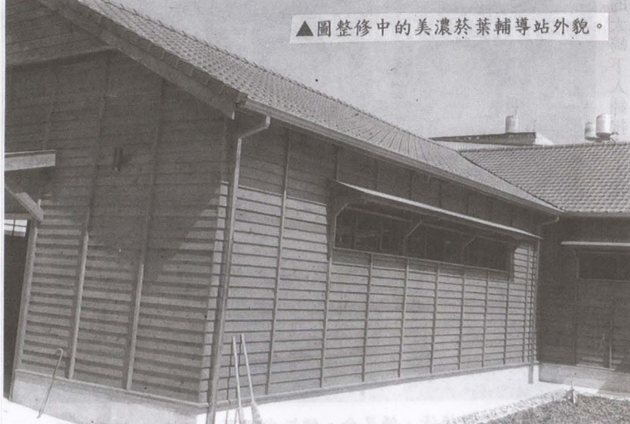
▲圖整修中的美濃菸葉輔導站外貌。

【水利會訊】經濟部水利署署長賴建信於11日下午率副署長鍾朝恭、副總工程師林元鵬、南區水資源局長連上堯、第七河川局長李宗恩等多位官員南下高雄農田水利會協助抗旱應變共同攜手渡過難關以期讓農民順利耕作。 近來高雄地區久未降雨，河川流量下降，109年初迄今缺水嚴重致一期農作農灌用水困難，水利會呂文豪會長表示：高雄農田水利會於農曆年期間即啟動非常灌溉輪灌計畫，年後水情不佳狀況持續立即指成立旱災緊急應變小組執行救旱工作並向水利署長報告中央能予以協助。 水利署長賴建信11日特地南下高雄農田水利會關切，並帶領水利署多位官員陪同到場了解協助，在聆聽高雄水利會簡報目前供灌狀況及因應措施後，賴署長當場指示第七河川局協助水利會隔日馬上聯絡廠商於降雨前辦理老農灌。會後由呂會長陪同賴署長等人赴現場視察旗山溪右岸旗山圳一幹線進水口進水情形，因旗山溪流心偏向左岸，且近日有雨汛，賴署長當場指示七河局立即協助水利會將旗山溪流心