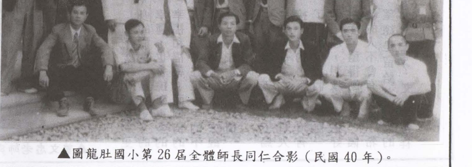
▲圖龍肚國小第26屆全體師長同仁合影(民國40年)。

難救助措施辦理方式說明如下： 1. 因罹患嚴重特殊傳染性肺炎(以下簡稱肺炎)死亡者，依據本市災害救助金核發辦法每人予以補助新臺幣20萬元，區公所勘災審核認定後，送社會局辦理補助款撥付。 2. 擔負家庭主要生計責任者，因受肺炎居家隔離或居家檢疫，無法工作致生活陷入困境，明顯無法維持基本生計，依據本市急難救助辦法予以補助一般戶每人新臺幣二千元，列冊本市中低收入戶每人新臺幣三千元，列冊本市低收入戶每人新臺幣四千元。