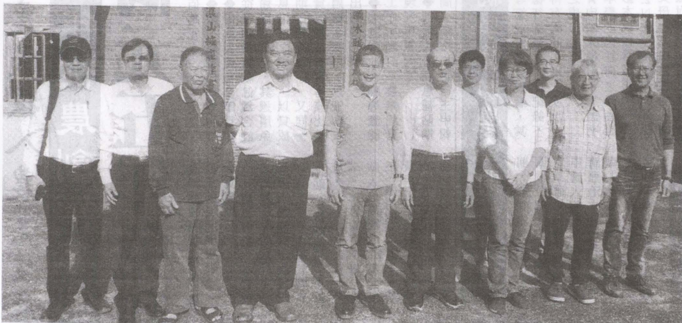
【客委會訊】客委會主任委員李永得15日前往美濃，視察白馬名家宋屋學堂空間整建工程。李主委表示，期盼白馬名家能逐步修復，發揮教育與文化等各項功能，再展書屋風華。

白馬名家宋屋學堂空間整建工程，李主委首先在美濃區公所視察後指出，現在首先要做的是搶救白馬名家現有的建築，透過結構補強等方式，避免建築主體受到風吹日曬持續惡化；其次要請美濃區公所先向客委會提出整體規劃設計案，同時利用約一年的時間，讓該處土地所有權人都能簽署施工同意書，避免未來施工後可能發生爭議；最後，要請屋主、地主及區公所共同思考整建完成後，由哪個單位管理、用途為何，讓修復後的白馬名家能夠永續經營，與當地居民共存共榮。